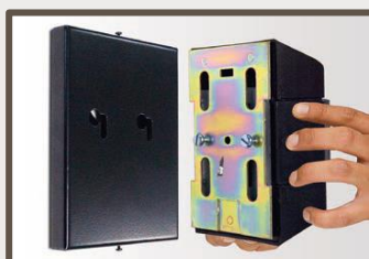
Removable (semi permanent)

Skru enkelt og sikkert fast på en vegg eller solid flate. Skruene er skjult i av endestykker for diskret montering