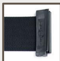
Anti – Tamper

Inkludert som standard med alle tensabarrier stolper og veggelementer. Gir maksimal sikkerhet ved å forebygge utilsiktet frigjøring av båndet.