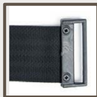
One way loop

Klipsen inneholder en Magnet slik at båndet kan være festet til metall overflater uten behov for et mottakeroppheng