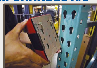
Warehouse rack mount

Skyves på en monteringsplate som er skrudd inn i en vegg, og gir en semipermanent installasjon.